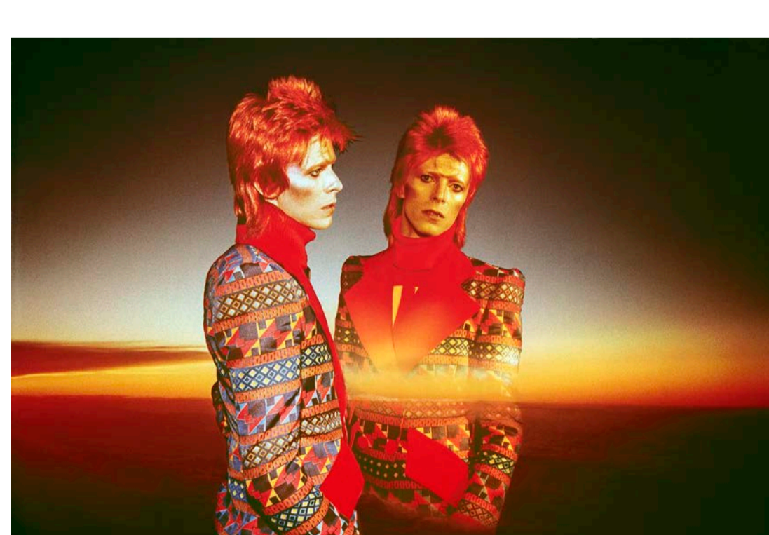
“David Bowie, Dawn of Hope, 1973”