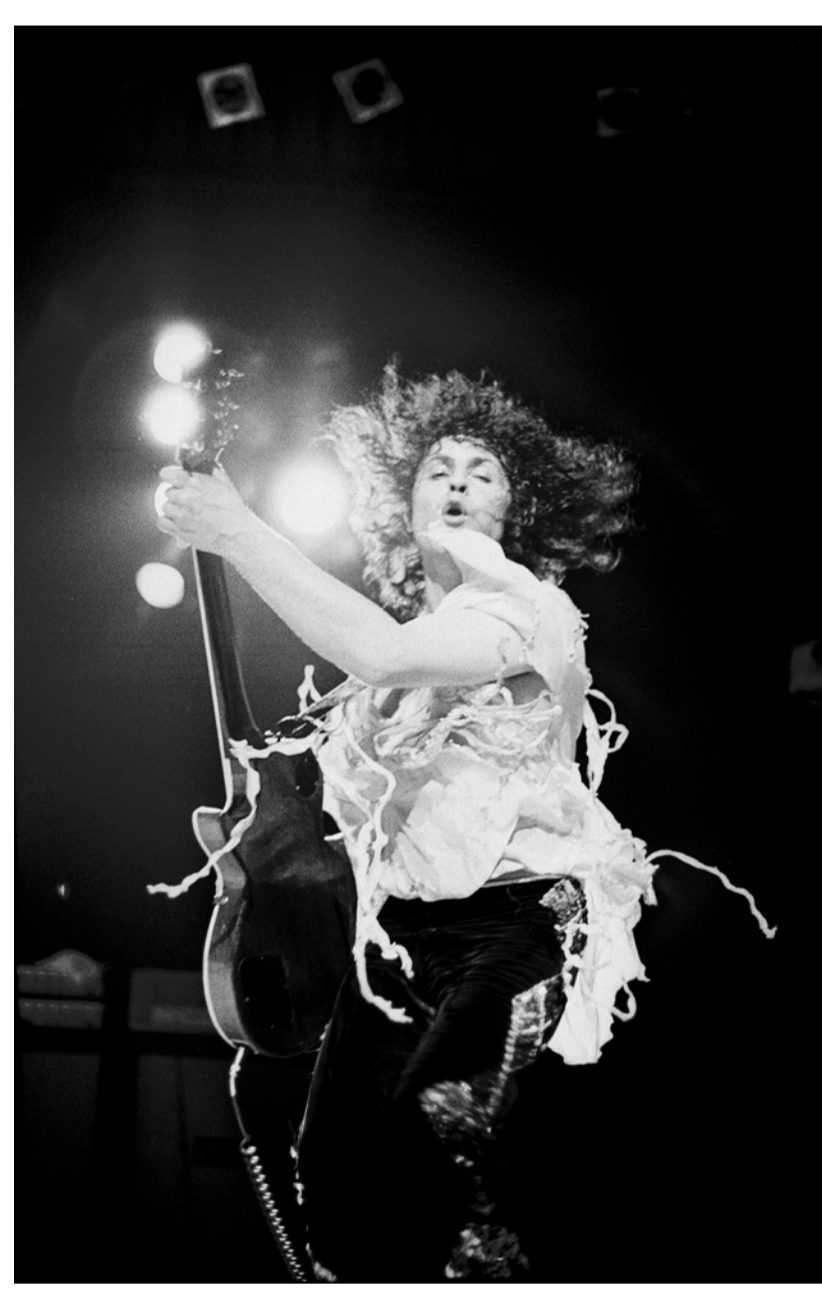
“T.Rex, Denki No Musha, 1972”