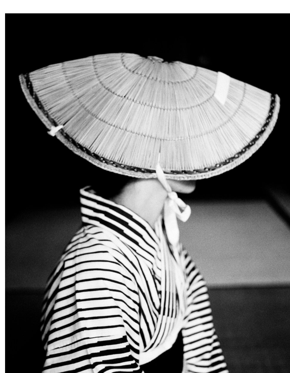
“Mother, Nogata, Fukuoka, 1957” (母、直方 1957年)