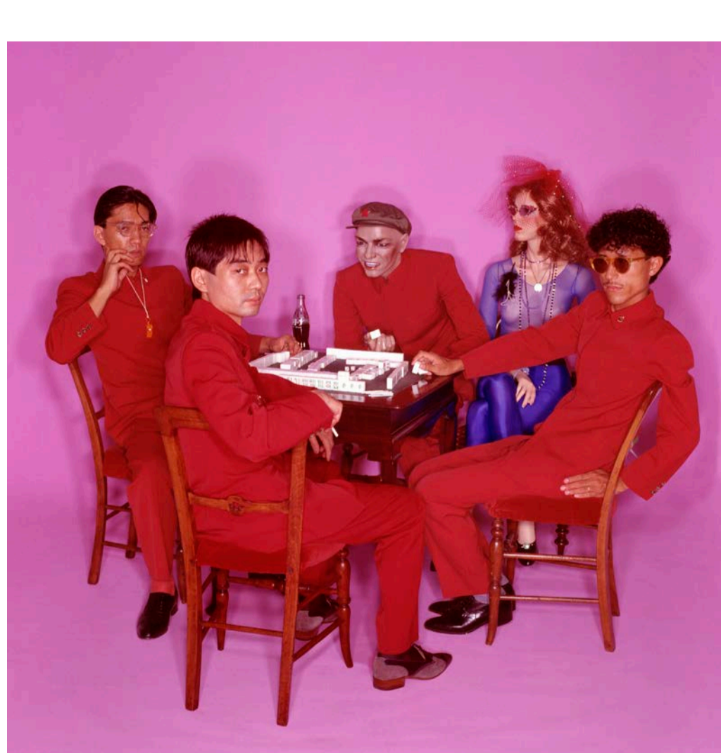
“Yellow Magic Orchestra - Solid State Survivor (Pink), 1979”