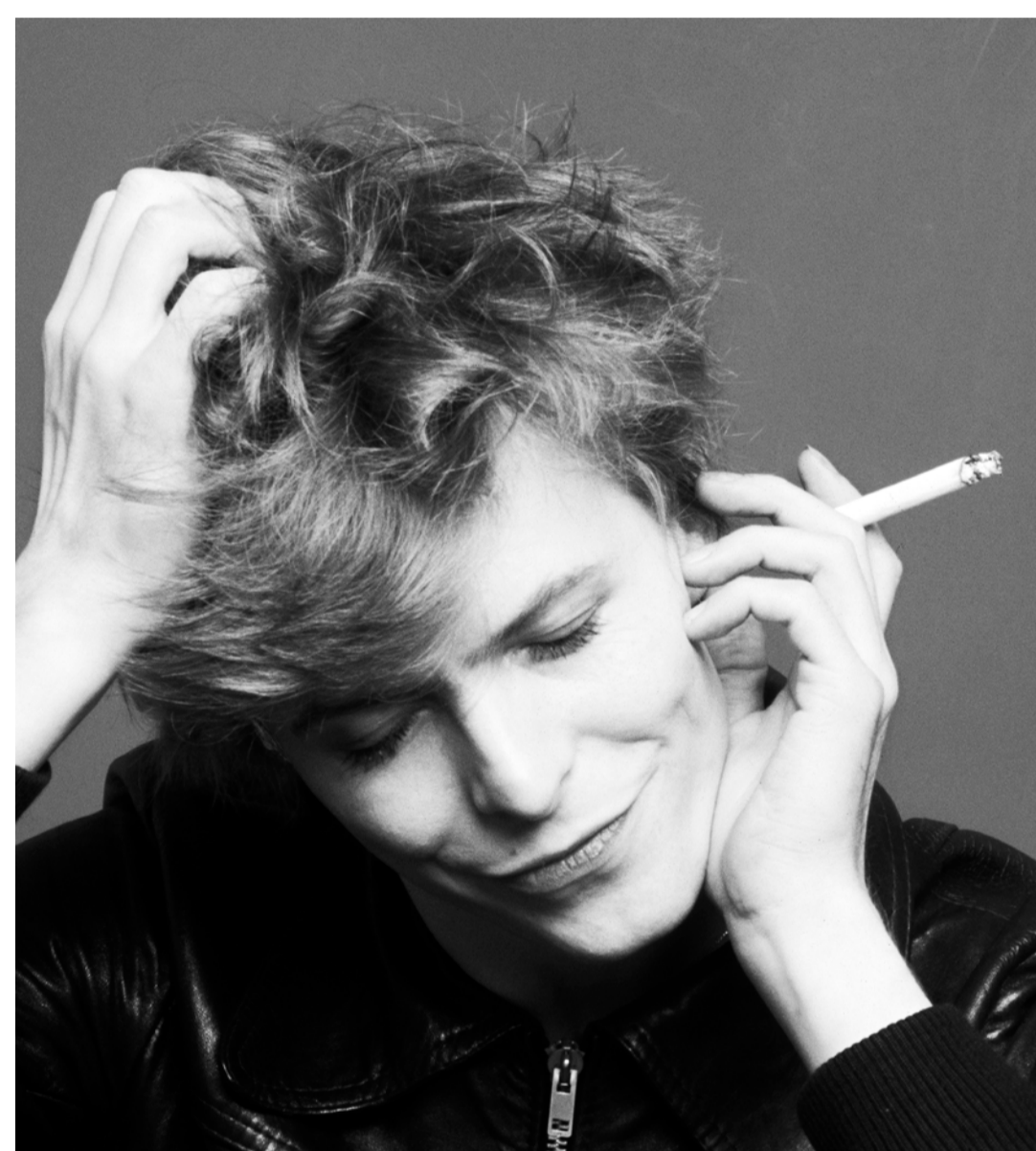
“David Bowie, Just for one day, 1977”

写真集「SUKITA ETERNITY」に収録された、デヴィッド・ボウイ、イギー・ポップ、マーク・ボラン、YMO、忌野清志郎などの代表的ポートレート作品、キャリアを通して撮影してきた風景、ストリートなどのパーソナル作品など合計約20点が展示予定です。また、写真集特装版の現物も紹介します。付属する3点のプリント作品の現物も名古屋において初めて展示いたします。その1枚は、カラー作品の名作デヴィッド・ボウイ「Hope of dawn」です。